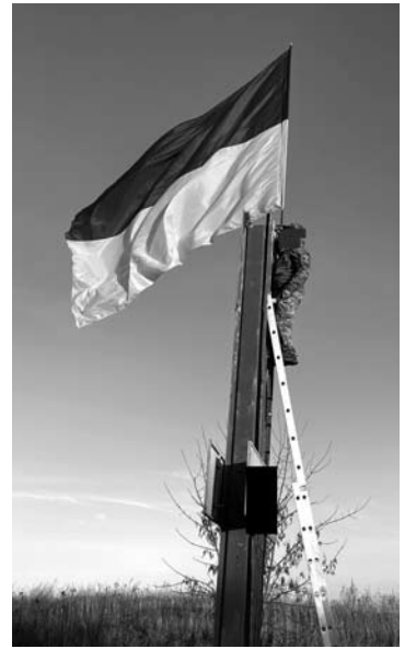
„Išprotėjęs savanoris“ kelia Ukrainos vėliavą išvaduojoje gyvenvietėje.