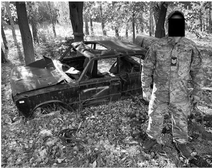
„Rembo“ prie „Žigulio“, kuriame sušaudė keturis okupantus ir vieną kaimo kolaborantą.

„Išprotėjusiu“ šį vidutinio amžiaus vyrą praminė kariškiai, pas kuriuos pirmą karo dieną savanoris nuvažiavo prašyti granatsvaiddžio bei minų, kad galėtų ginti savo sodybą ir blokuoti kelią į Charkovą. Vyriško toks epitetas neįžeidė, bet paskatino žodį „išprotėjęs“ pasirinkti savo slapyvardžiu, tad vėliau, vykdamas pas kariškius derinti veiksmų ar šiems skambindamas, prisistatydavo „Išprotėjusiu savanoriu“. Jį kariškiai neretai vadina ir kitu slapyvardžiu – „Rembo“.